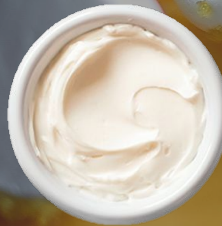
Deli CHEESECAKE 2.0